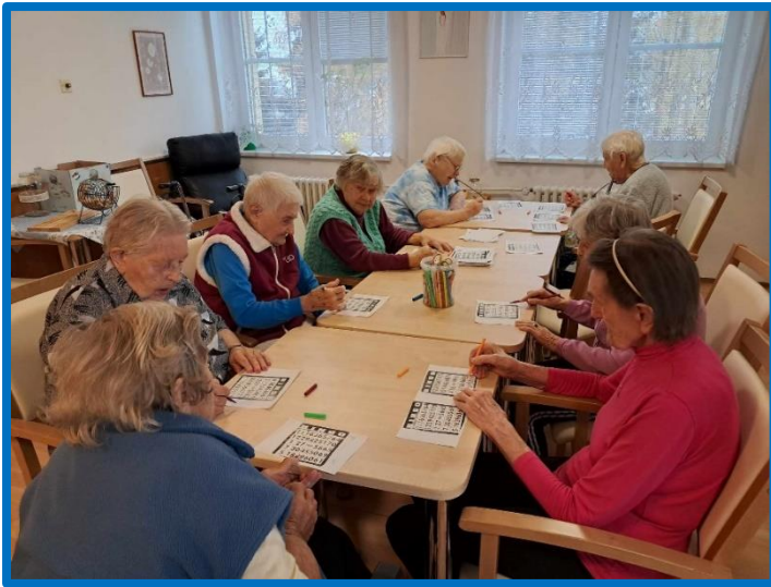
Hráli jsme společenské hry.