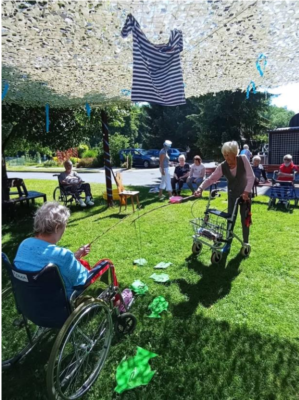
Užili jsme si Den námořníků