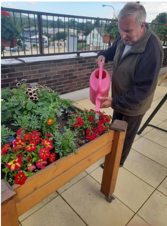
Pečovali jsme o zahrádky a trávili jsme hodně času venku