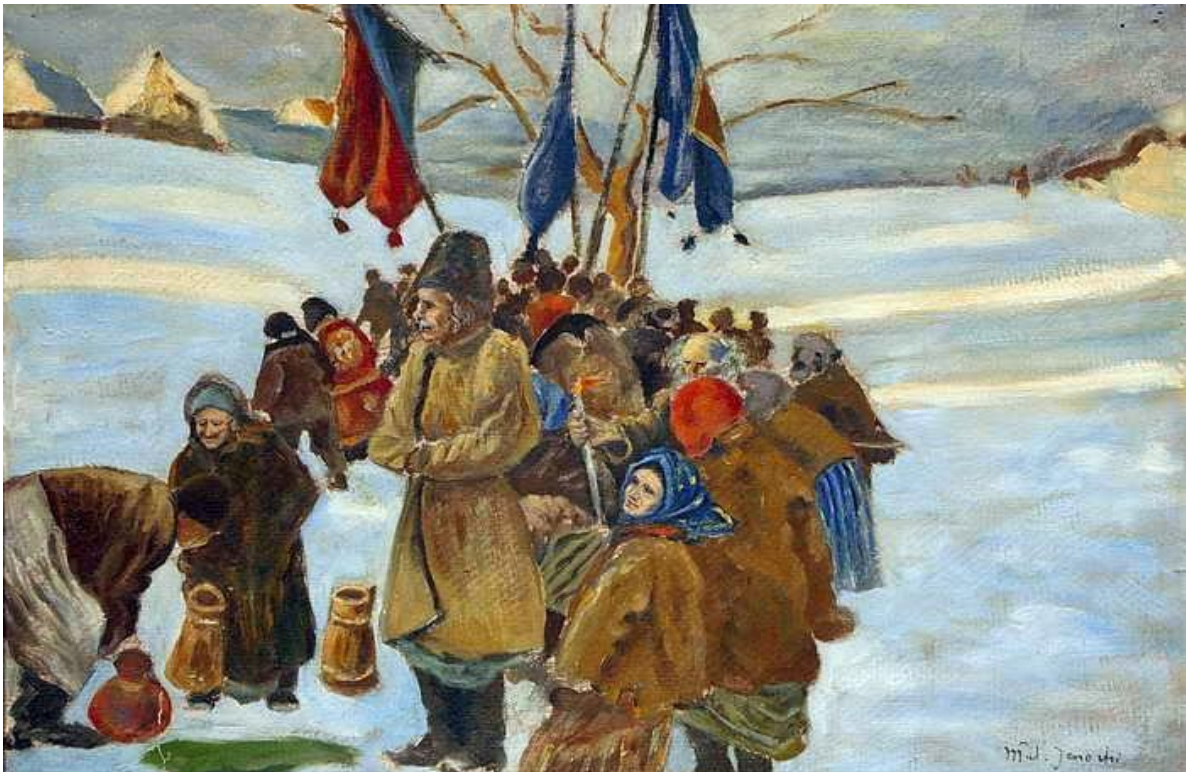
Svěcení vody na Hromnice v Karpatech. Počátek 20. století, Wladyslaw Jarocki

Postavte misku se sladkým mlékem s nadrobeným čerstvým chlebem na kuchyňskou linku pro „hospodářičky“. Tak říkali Slované malým polobožským bytostem, které střežily dům. Co je však důležitější, zabezpečovaly hojnost, zdraví, prostě dostatek všeho. Milují čerstvé mléko, takže pokud jim každý den nabídnete v malé nádobce trochu mléka, budou pečovat o rozkvět a blahobyt vašeho domova i všech jeho obyvatel.